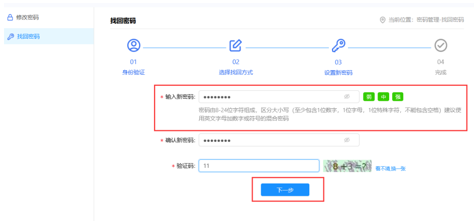
图 5：修改完口令后点击“下一步”

5、微信端确认完后，页面直接进入口令重置页面，输入新的口令（需要符合口令规范）及验证码，点击“下一步”即可完成口令修改过程，如图 5 所示，使用新口令可登录统一身份认证平台：