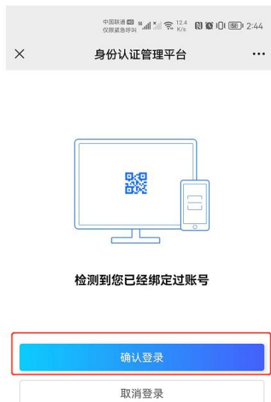
图 4：扫码后点击“确认登录”